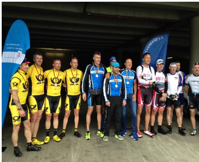
DBM-Radfahren Team: 1.Platz BSG Aurubis Hamburg