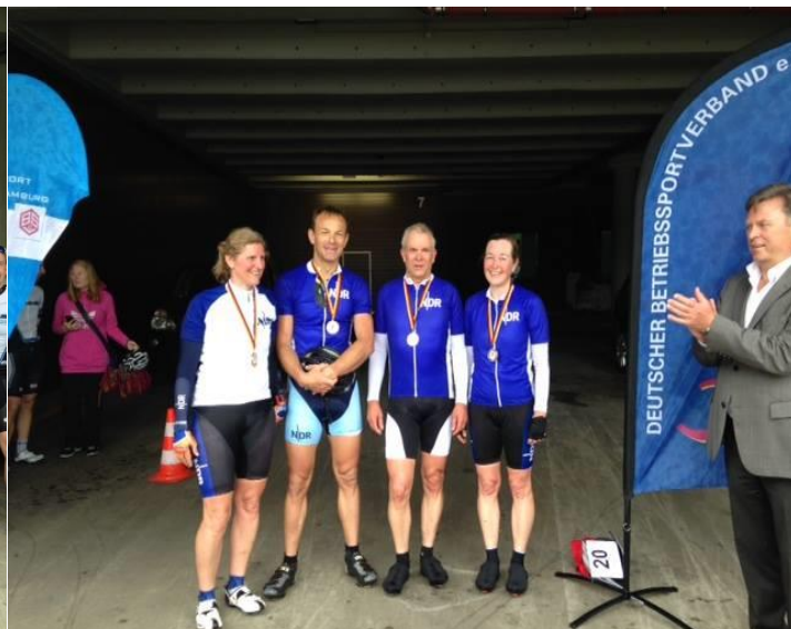
1.Platz NDR - Mixed