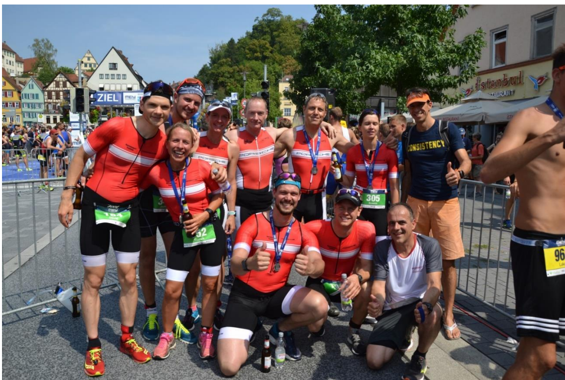
BSFG Porsche Triathlon